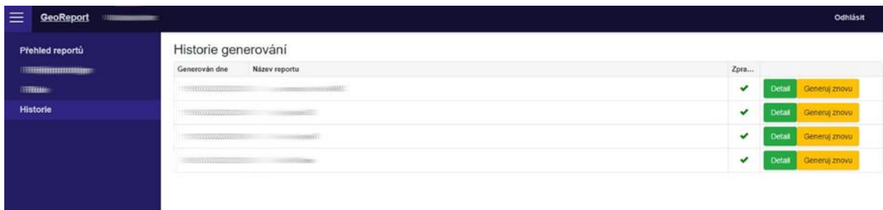
Obr.: Zobrazení historie vygenerovaných georeportů přihlášeného uživatele.

každého reportu možnost pomocí tlačítek „Detail“ a „Generuj znovu“ zobrazit podrobné údaje o vygenerovaném reportu, případně provést opakované generování georeportu. V případě opakovaného generování georeportu se uživateli zobrazený formulář pro zadání vstupních parametrů předvyplněný na základě posledně použitých vstupních hodnot, které má možnost uživatel upravit. V případě, že se nezobrazuje tlačítko „Generuj znovu“, vybraný typ georeportu již není na základě změny nastavení administrátorem danému uživateli přístupný.