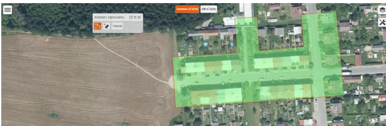
Obr.: Rozhraní pro zakreslení polygonu zájmového území georeportu.

Dle charakteru každého konkrétního georeportu mohou být na formuláři zobrazena i další pole, do nichž je nutné vyplnit vstupní parametry reportu. Speciální položkou formuláře mimo běžná pole může být tlačítko „MAPA“. To vyžaduje zakreslení polygonu zájmového území. Po kliknutí na tlačítko je uživateli otevřeno nové okno s mapovou aplikací, kde zakresluje polygon zájmového území. Přidávání vrcholů polygonu provádí uživatel klikem levým tlačítkem myši do mapy. Pravým tlačítkem se ukončuje kresba. Po dokončení kresby je nutné pomocí tlačítka „Odeslat“ v dialogu „Kreslení zájmového území“ ukončit režim zadávání zájmového území. Tím je uživatel přesměrován zpět na formulář. Po kompletní vyplnění parametrů formuláře uživatel stiskne tlačítko „Odeslat ke zpracování“. Následně dojde k odeslání žádosti o report a její zařazení do fronty ke zpracování. Po zpracování reportu je uživateli výsledný PDF soubor odeslán na zvolenou emailovou adresu.